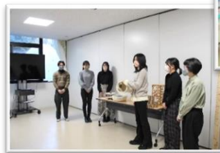
企業等への新たな提案