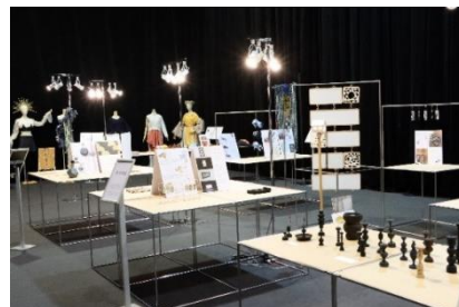
～昨年「地域デザイン展 2021」の様子～