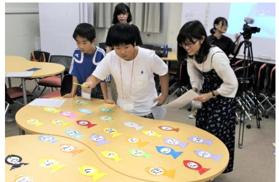
▲昨年の「こどもくずし字教室」の様子